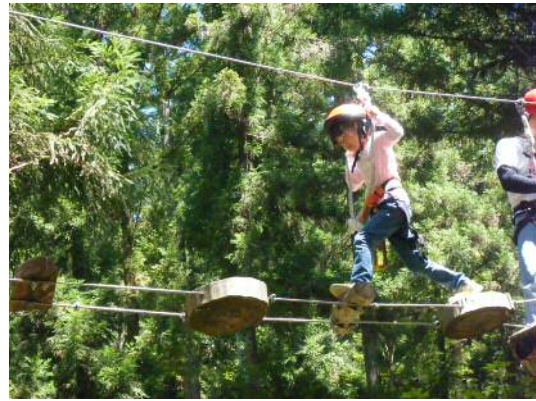
森のニンジャ体験