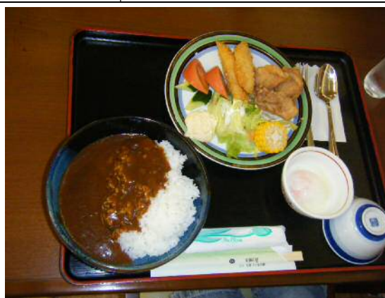
岩屋ダムカレー(1日目昼食)